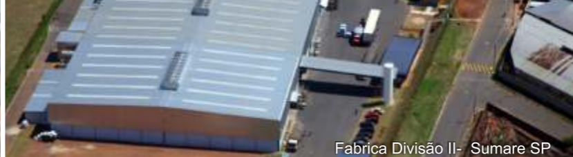
Fabrika Divisao II - Sumare SP