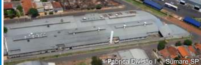
Fabrika Divisao I - Sumare SP