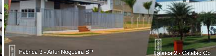
Fabrika 3 - Artur Nogueira SP